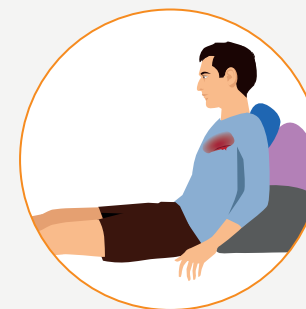
Les positions d'attente

La journée est rythmée par des exposés et des ateliers d'apprentissage des gestes de premiers secours.